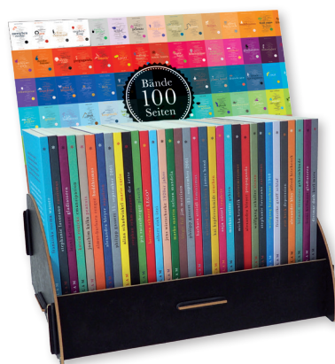
Display »100 Seiten« ISBN 978-3-15-089020-2