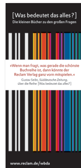
Prospekt (VE 25 St.) »Was bedeutet das alles?« ISBN 978-3-15-089087-5