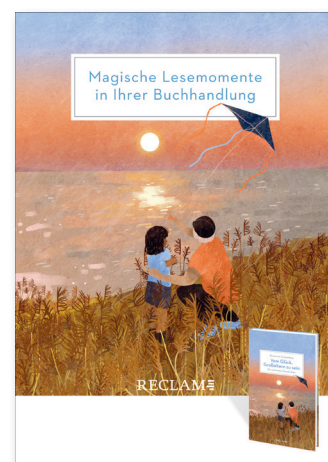
A1-Plakat »Großeltern« ISBN 978-3-15-089129-2