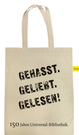
150 Jahre Universal-Bibliothek Baumwollbeutel. VE 10 Stück ISBN 978-3-15-92005-3 · € 10,00