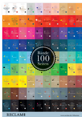
A2-Plakat »100 Seiten Jubiläum« ISBN 978-3-15-089130-8