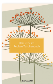
Prospekt (VE 25 St.) »Klassiker im Taschenbuch« ISBN 978-3-15-089114-8