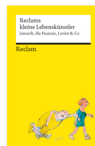
Prospekt (VE 25 St.) »Kleine Lebenskünstler« ISBN 978-3-15-089145-2