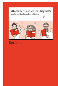
Prospekt (VE 25 St.) »Rote Reihe« ISBN 978-3-15-089143-8