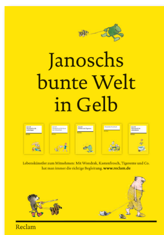
A2-Plakat »Janoschs bunte Welt in Gelb« ISBN 978-3-15-089147-6