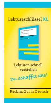
Prospekt (VE 25 St.) »Lektüreschlüssel XL« ISBN 978-3-15-089045-5