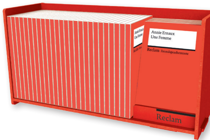
Display »Rote Reihe« ISBN 978-3-15-089144-5