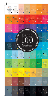
Prospekt (VE 25 St.) »100 Seiten Jubiläum« ISBN 978-3-15-089132-2