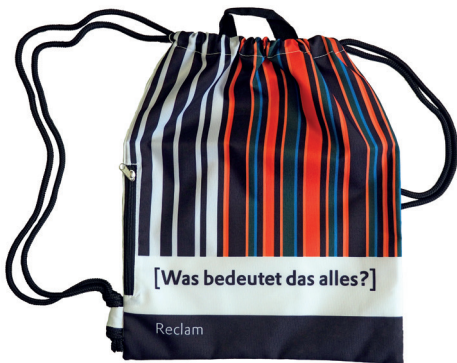
Reclams Denksportbeutel ISBN 978-3-15-095001-2 UVP € 14,-