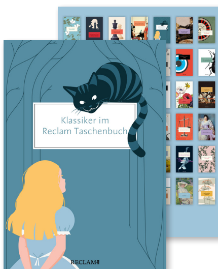
A1-Wendepublikation »Klassiker im Taschenbuch« ISBN 978-3-15-089141-4