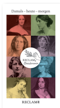
Prospekt (VE 25 St.) »Reclams Klassikerinnen« ISBN 978-3-15-089140-7