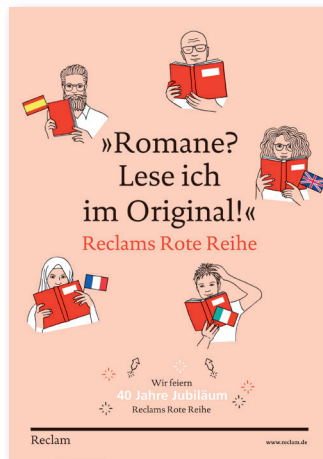
A2-Plakat »Rote Reihe« ISBN 978-3-15-089142-1