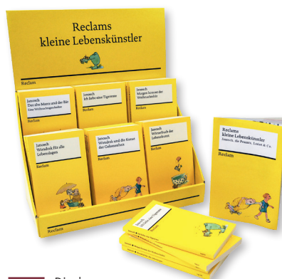
Display »Kleine Lebenskünstler« ISBN 978-3-15-089128-5